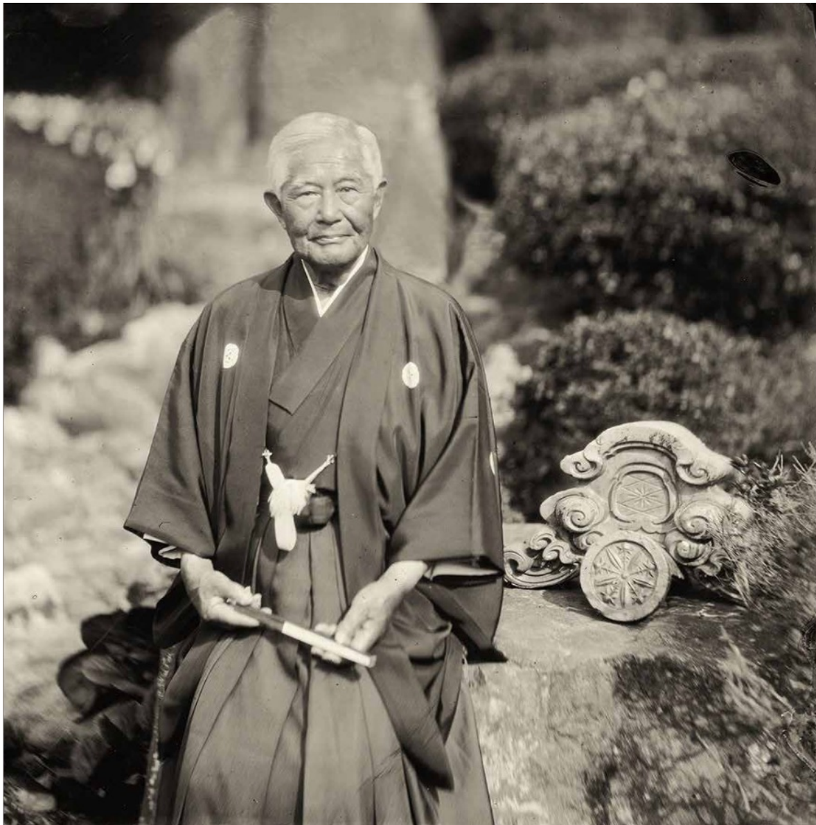
波多野氏(福井県永平寺町在住、大本山永平寺の開祖・道元禪師を越前に勧請した、鎌倉幕府幕臣の北条氏家臣・波多野義重の子孫)